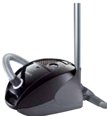
GL 32222 met 2200 Watt, HEPA-hygiënefiltersysteem (anti-allergie) en omschakelbaar rolmondstuk