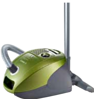
GL 32015 met 2000 Watt, Air Clean II hygiënefiltersysteem en omschakelbaar rolmondstuk

De nieuwe GL-30-stofzuigers van Bosch met Bionic Filter zijn er in vier verschillende modellen met dynamische kleuren.