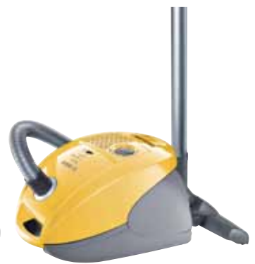
GL 32223 ProParquet met luxe parketborstel en omschakelbaar rolmondstuk