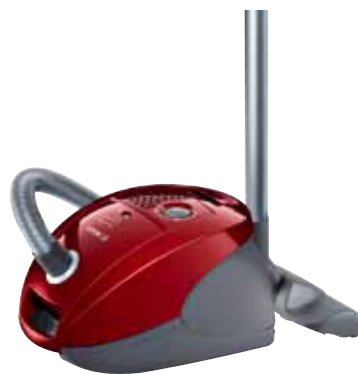
GL 32125 met 2100 Watt, Air Clean II hygiënefiltersysteem en vloermondstuk voor dierenharen